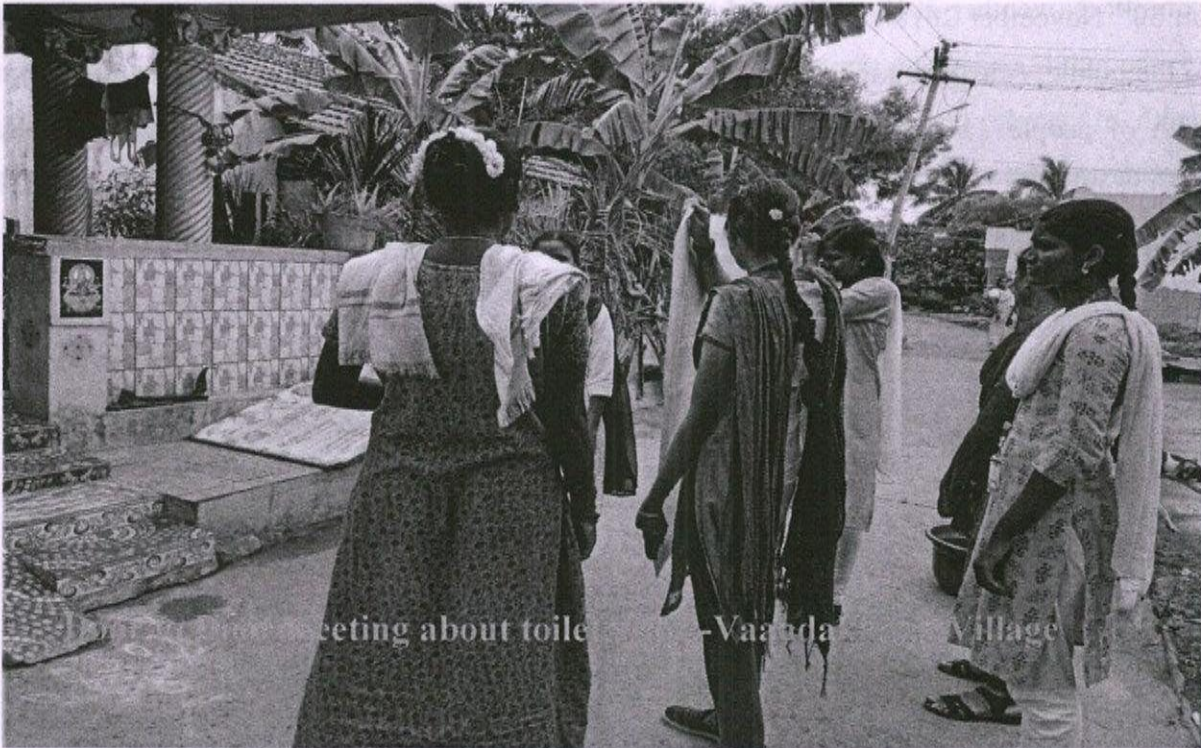
Meeting about toilet - Vaabada Village