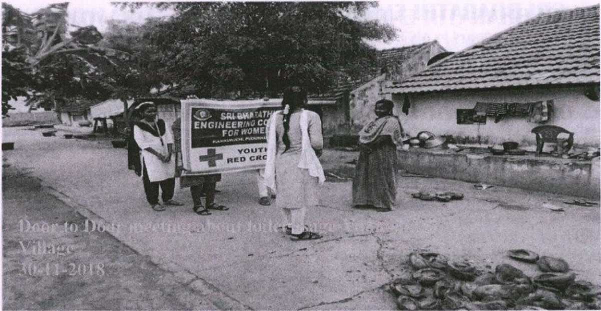
Door to Door meeting about toilet Village 30-11-2018